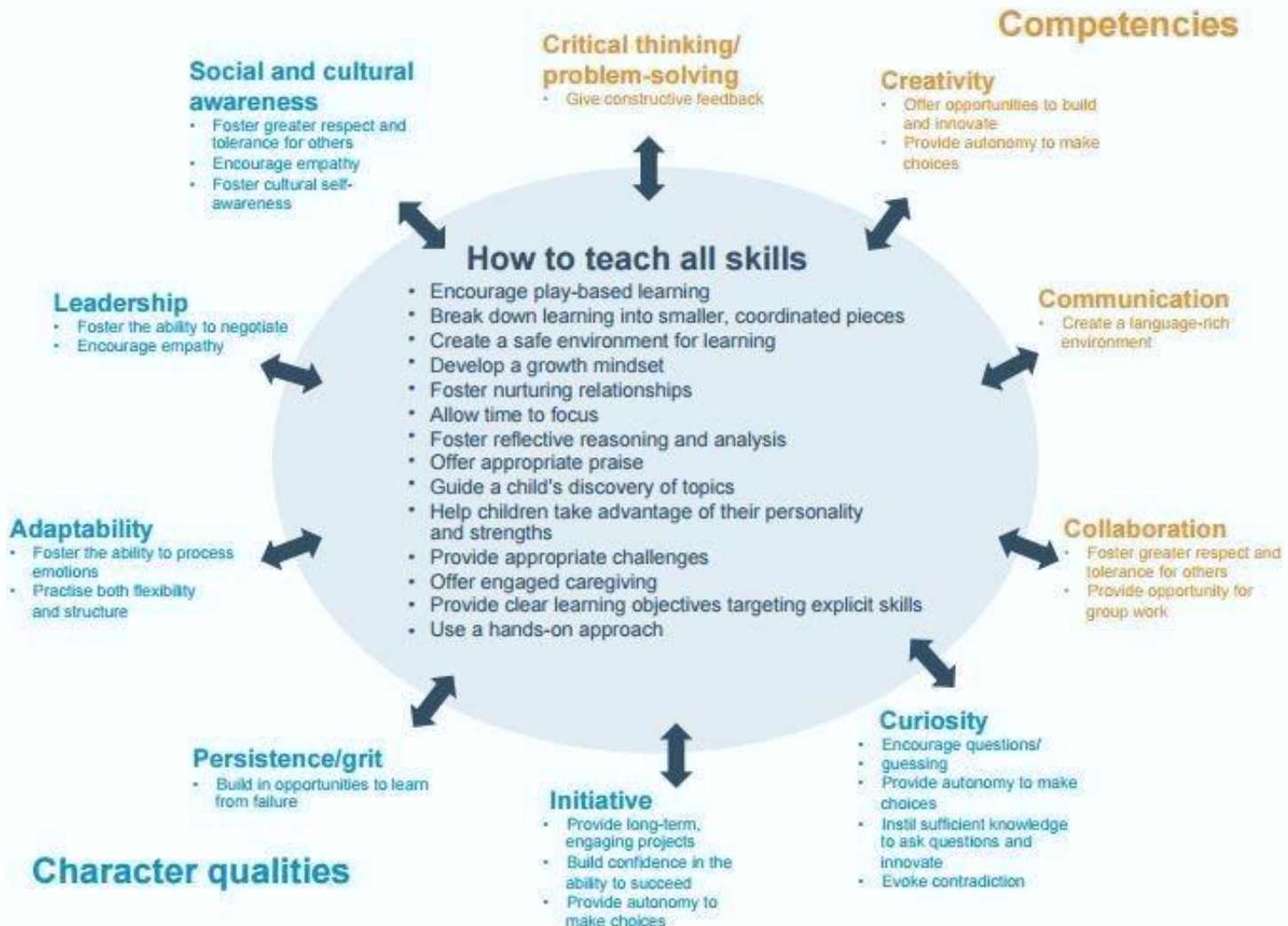
Exhibit 3: A variety of general and targeted learning strategies foster social and emotional skills