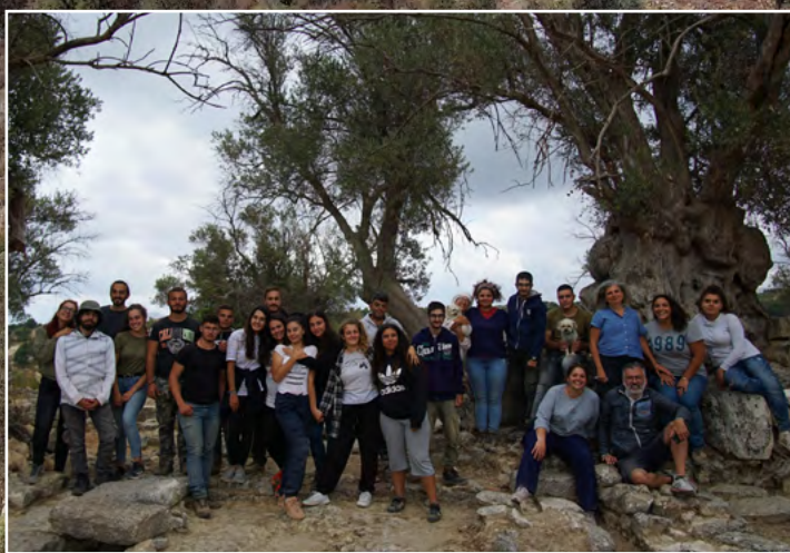
Η ανασκαφική ομάδα του 2021 στο Πυργί