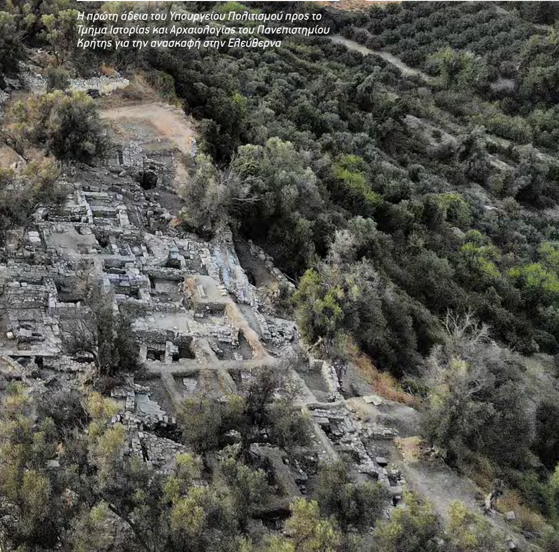
Αεροφωτογραφία της Ακρόπολης της Ελευθέρνας (2021)