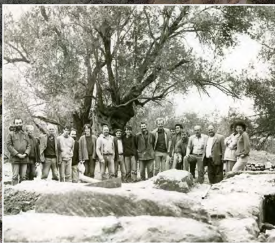
Η ανασκαφική ομάδα του 1986 στο Πυργί

Οι φετινές εργασίες ξεκίνησαν και διαρκούν όλο τον Σεπτέμβρη. Επιπλέον η αρχαιολογική ανασκαφή στο Πυργί της Ελεύθερας θα είναι ανοικτή στο κοινό την Κυριακή 2 Οκτωβρίου, κατά τις ώρες 18.00 – 20.00, και συγχρόνως θα είναι επισκέψιμος και ο χώρος όπου εργάζεται η ερευνητική ομάδα της πανεπιστημιακής ανασκαφής του Τομέα II, στο Παλαιό Σχολείο της Αρχαίας Ελεύθερας.