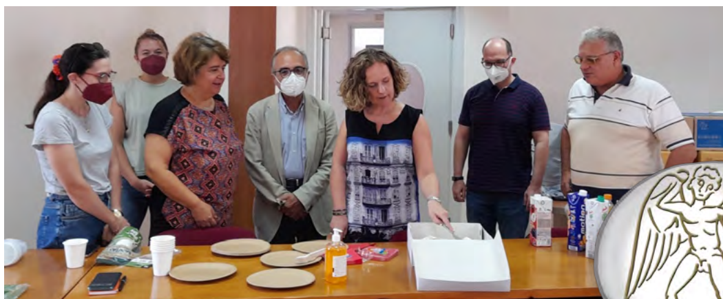
Εορτασμός στο ΚΕΜΕ-ΠΚ για το ερευνητικό πρόγραμμα

Το ερευνητικό πρόγραμμα, που θα υλοποιηθεί στη Φιλοσοφική Σχολή του ΠΚ στο ΚΕΜΕ-ΠΚ, έχει διάρκεια πέντε έτη (2023-2028) και δομείται πάνω σε πέντε άξονες, οι οποίοι υπαγορεύουν τις αντίστοιχες δράσεις του: